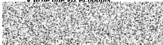
za Zhotovitele Ing. Ivo Skřivánek jednatel